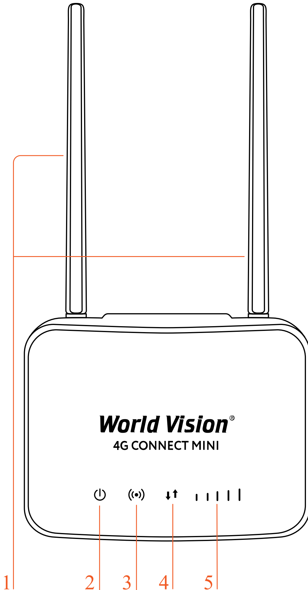
1. Знімні 4G LTE антени тип конектора SMA (male)